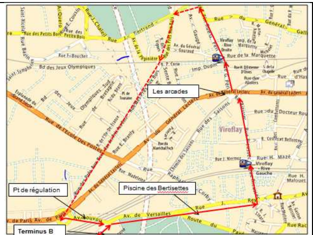
Fig.2 : Du terminus du Bus B, une navette de petit gabarit tourne en boucle pour desservir les 2 gares.