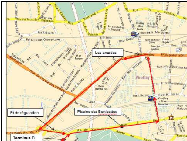
Fig.1 : le bus B continue jusqu'à Viroflay RG par la rue Rey : Trajet naturel mais problème de gabarit.