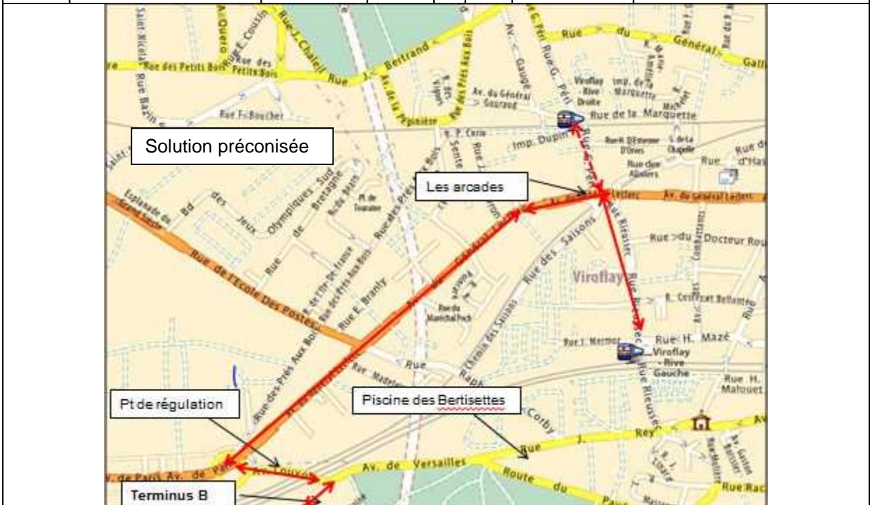
Fig 5 : Le bus B continue par la place Louis XIV et l'avenue du général Leclerc jusqu'à Viroflay RG après un arrêt aux Arcades où il dépose les passagers qui peuvent se rendre à pied à Viroflay RD.