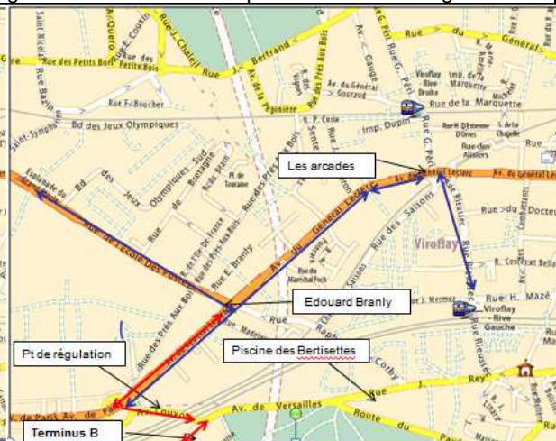
Fig. 4 : le bus D allant vers Viroflay RG fait un détour par la place Louis XIV pour se connecter au BusB.